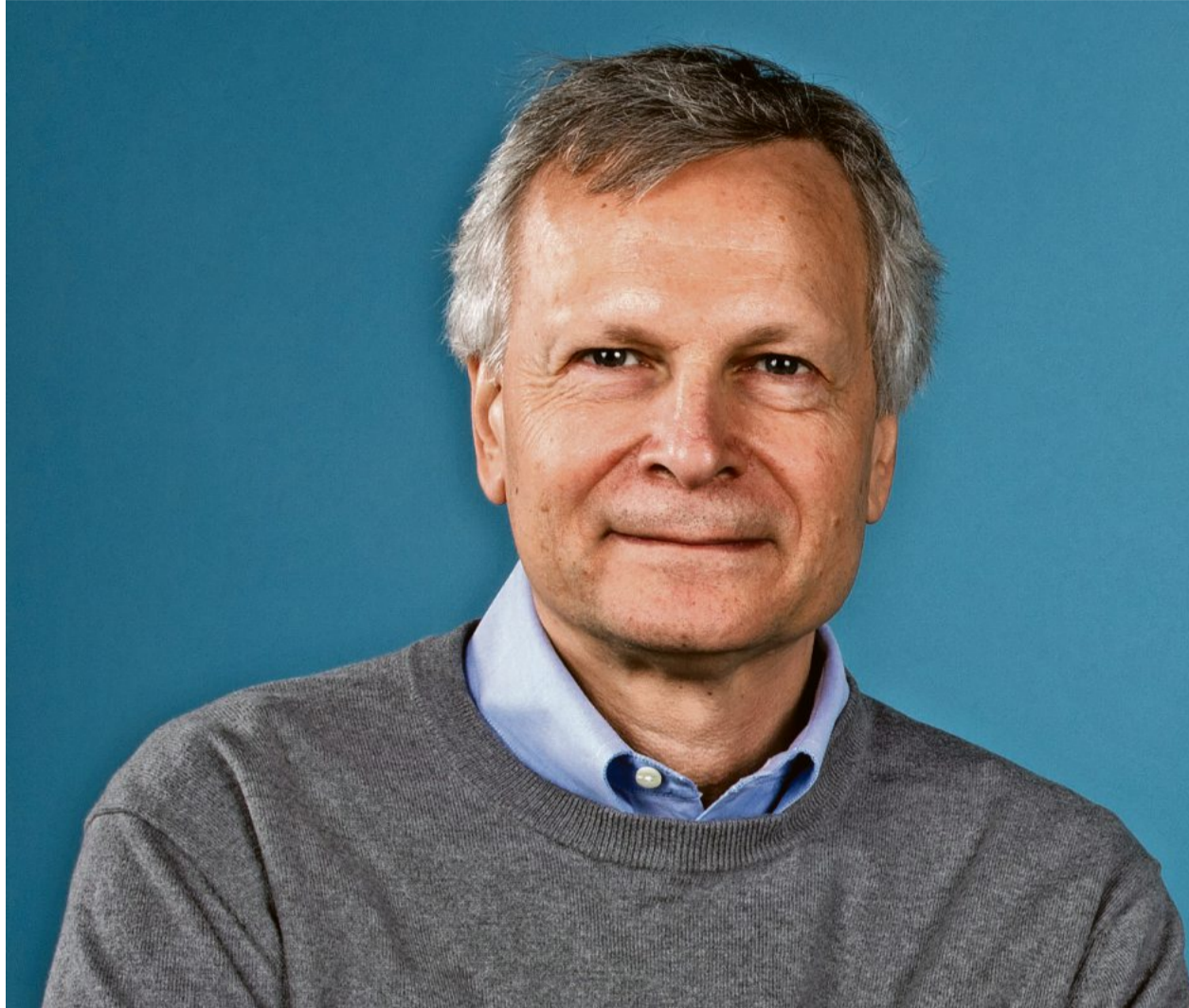
Dani Rodrik, 62 Jahre, ist in der Türkei aufgewachsen. Seit Mitte der siebziger Jahre lebt er in den Vereinigten Staaten.